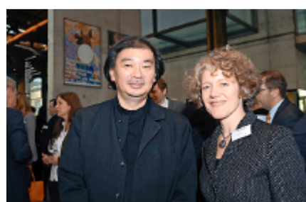
Architekt Shigeru Ban mit der Zürcher Stadtpräsidentin Corine Mauch.