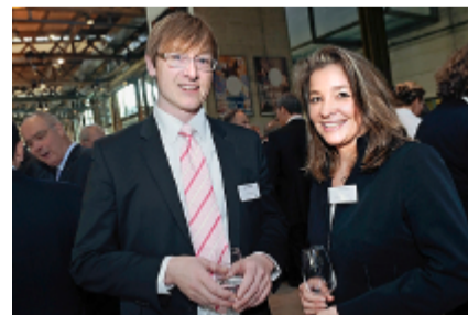
Preisüberwacher Stefan Meierhans und Nationalrätin Barbara Schmid-Federer.