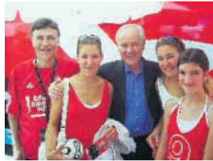
LUZI STAMM (SVP/AG) posiert auf seinem Profil stolz mit seinen drei Töchtern und dem ehemaligen Fussball-Naticoch Kobi Kuhn.

«Die Leute, die sich registrieren wollen, kann man nicht alle kontrollieren», weiss Levrat. Und nimmt gelassen: «Facebook ist wie eine politische Versammlung, dort gibts auch keine Zutrittskontrollen.» Auf der Internet-Plattform formieren sich auch Gruppen, die sich gegen national bekannte Politiker wie Levrat wenden. «Einer solchen Gruppe bin ich beigetreten – sie hat sich dann sofort aufgelöst.» Kritik auf Facebook müsse man locker nehmen. «Wenn man das nicht kann, hat man in der Politik ohnehin nichts verloren.»