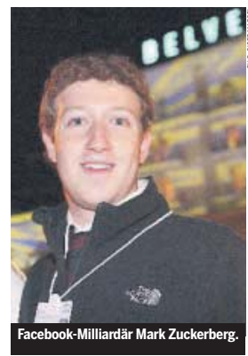
Facebook-Milliardär Mark Zuckerberg.

Er wird in Zukunft sensibler mit dieser Thematik umgehen müssen, ansonsten werden Facebook die Freunde schon bald davonlaufen. BENJAMIN WEINMANN