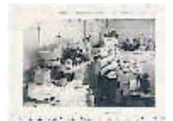
JOSEF ZISYADIS (PDA/VD) stellt sogar Fotos aus seiner Kindheit online.