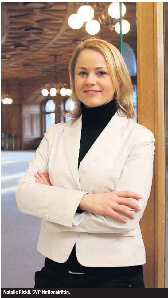
Natalie Rickli, SVP-Nationalrätin.

book ausschliesslich für die politische Arbeit. «Ich war lange skeptisch, dann hat mich der Wahlkampf von Barack Obama überzeugt.» Für dessen fulminanten Erfolg beim US-Präsidentenwahlkampf sei entscheidend gewesen, dass er über das Internet Leute mobilisieren konnte.