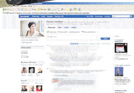
PASCALE BRUDERER (SP/AG) erhält auf ihrer Pinnwand Nachrichten von ihren Freunden. Der Inhalt wurde aus Gründen des Persönlichkeitsschutzes verfremdet.