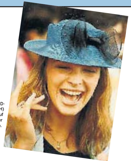
BARBARA SCHMID-FEDERER (CVP/ZH) zeigt sich auf Facebook von ihrer privaten Seite.