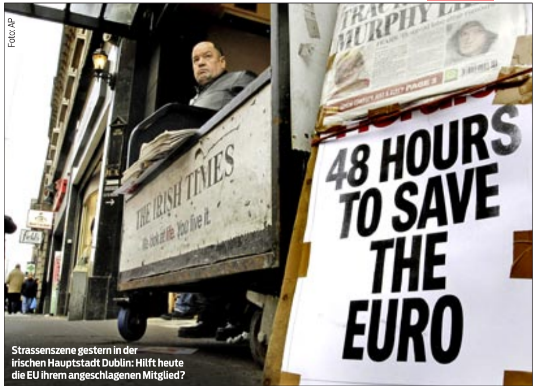
Strassenszene gestern in der irischen Hauptstadt Dublin: Hilft heute die EU ihrem angeschlagenen Mitglied?