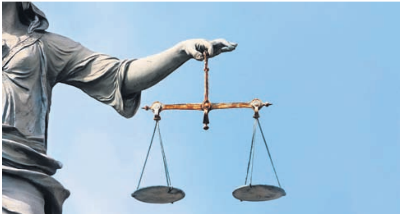
Der Staat muss abwägen. Die Menschenrechte müssen auch bei Ausschaffungen eingehalten werden.

GENERALVERDACHT. Noch ist es nicht so weit. Doch die Befürworter des Gegenvorschlags kämpfen mit dem Rücken zur Wand. Zu schaffen macht ihnen vor allem etwas: der Verdacht, sich auf die Seite der kriminellen Ausländer zu schlagen. Wer diesen Vorwurf nicht aus der Welt schaffen kann, der hat in Zeiten aufgeheizter Ausländerdebatten einen schweren Stand. Wie absurd der Vorwurf ist, beim Gegenvorschlag würden die kriminellen Ausländer mit Samthandschuhen angefasst, zeigt ein Blick auf den Abstimmungstext. Der Gegenvorschlag enthält einen abschliessenden Katalog