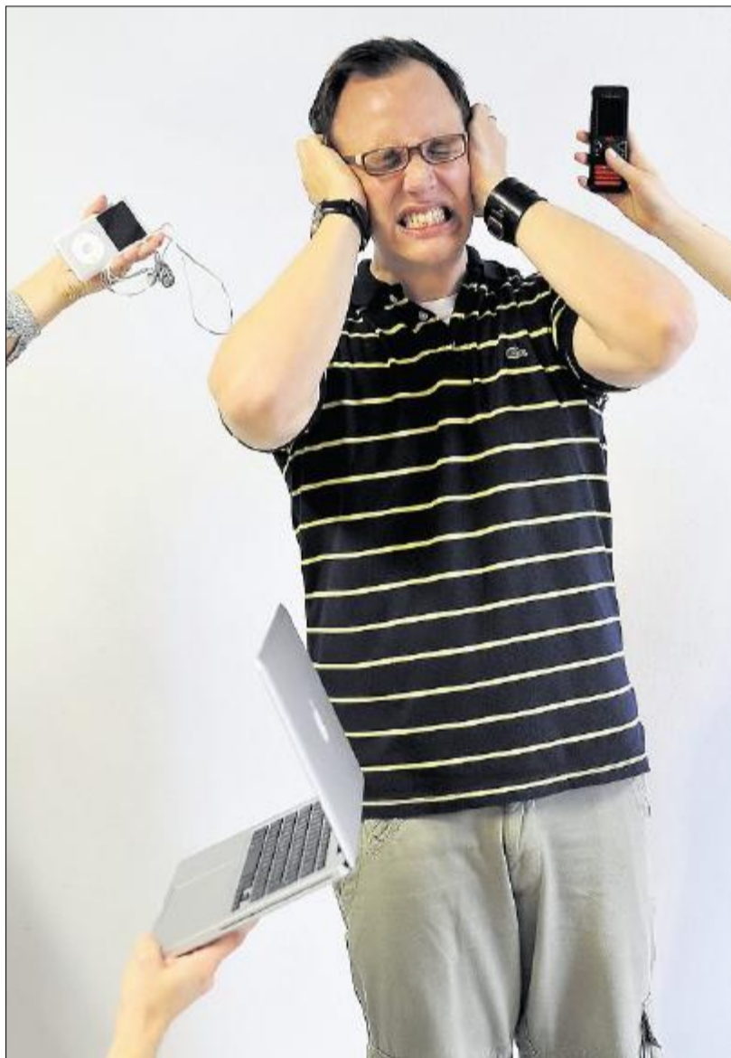
Der Verlockung der Technik zu widerstehen, ist alles andere als leicht.