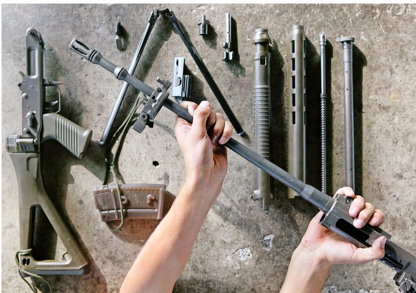
Schweizer Sturmgewehre sollen künftig auch in Bürgerkriegsländer exportiert werden können.

Unter den sechs Frauen findet sich mit Natalie Rickli auch eine SVP-Nationalrätin. Sie betont, dass man als neutrales Land hier keine neuen Unsicherheiten schaffen sollte: «Die angedachte Ausweitung schießt über das Ziel hinaus.» CVP-Nationalrätin Barbara Schmid-Federer weist auf den zweiten Punkt der geplanten Änderung hin. Rüstungsfirmen hatten in einem Brief an die Mitglieder der Sicherheitspolitischen Kommission verlangt, dass Ausfuhrbewilligungen nicht wie bisher eines, sondern zwei Jahre gültig sind. Das geltende Gesetz sehe bewusst vor, dass der Bundesrat ein