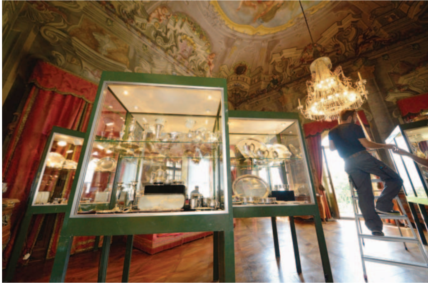
Dans le grand salon, sous des fresques baroques de 1740 peintes à sept mètres de haut par les frères Petri, de Lugano, les équipes de l'Hôtel des ventes de Genève installent les vitrines où est présentée une partie des objets précieux qui seront proposés aux enchères.

L'exposition de ces objets encore en cours d'installation four-