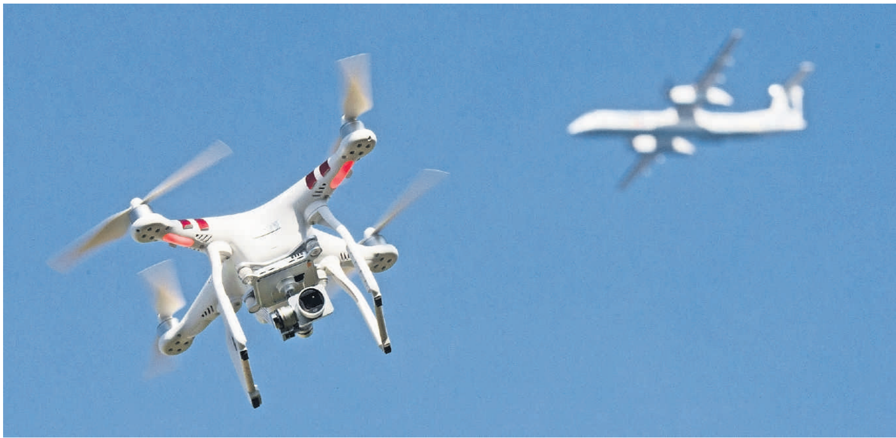
Eine Sicherheitsanalyse soll klären, ob in Dübendorf für das WEF eine Drohnenabwehr-Anlage benötigt wird.

Ein Fluggerät, das unerlaubt in einen gesperrten Luftraum eindringt, kann von einer Drohnenabwehr-Anlage abgefangen werden. Neuste Systeme, wie etwa des deutschen Herstellers Aeronia, sind in der Lage, Drohnen über deren Signale, die sie an den Piloten sendet, präzise zu orten. Je nach Beurteilung der Bedrohung kann der Störsender des Systems eingesetzt werden. Dieser